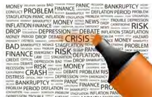
UNA IMMAGINE SIMBOLO