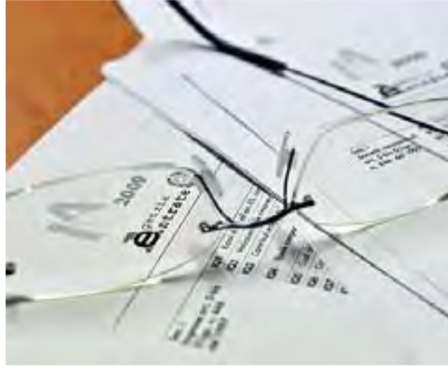
Un modello per la compilazione dell'Irap