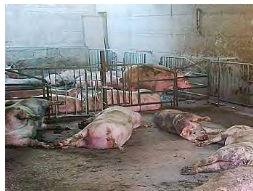
Maiali abbattuti perché affetti da peste suina