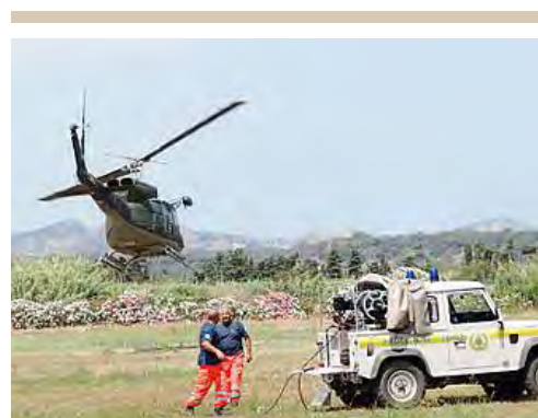
Elicottero e volontari impegnati nelle ricerche