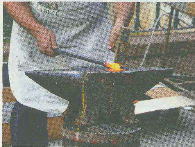
Un fabbro al lavoro

Agli imprenditori sassaresi su 50mila euro restano in cassa solo 16.745 euro, dopo aver pagato le tasse. Le decurtazioni più contenute si registrano a Oristano (2,6%, cioè 559 euro su 20.630 euro di reddito