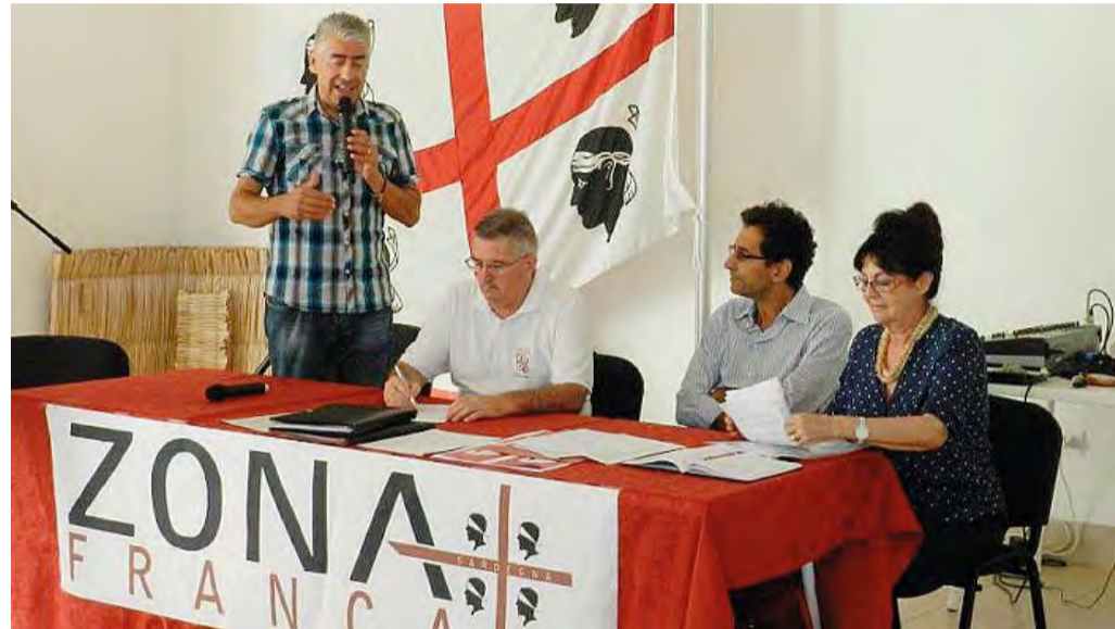
Il tavolo della presidenza all'assemblea dei comitati per la zona franca a Santa Giusta