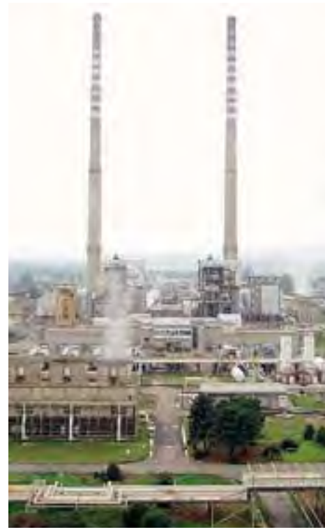
La centrale elettrica di Ottana