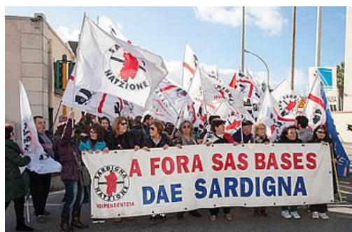
Un momento della manifestazione