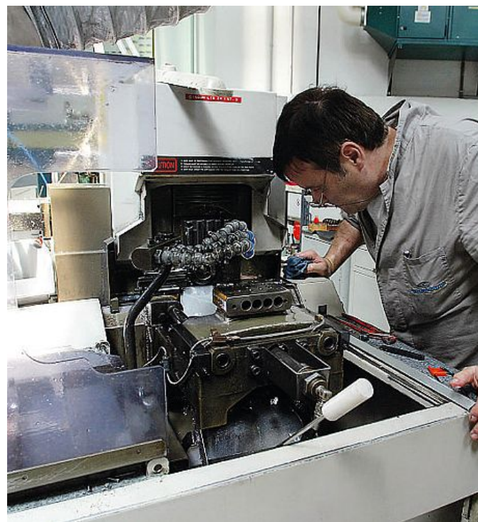
Le imprese artigiane sono in grande difficoltà nell'isola

su tutti, a patto che siano rimessi in ordine, come chiedono le banche, l'Artigianacassa e come vuole anche l'assessore alla Programmazione. Tra gli altri strumenti il Mediocredito e il Fondo di garanzia della Sfirs. Alla Sfirs il bilancio del 2015 assegna anche 30 milioni di euro per un Fondo Equity destinato alle filiere e all'internazionalizzazione. Insomma la liquidità c'è ma anche le regole da rispettare.