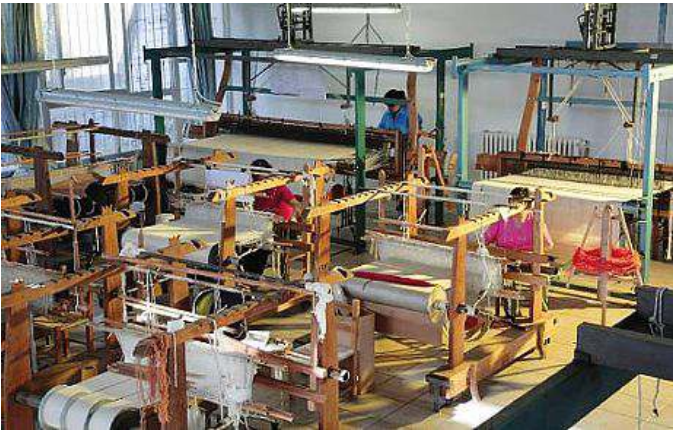
Un'azienda di tessuti

vertito il presidente e il segretario regionali della Cna, Pierpaolo Piras e Francesco Porcu (con loro anche il presidente nazionale Daniele Vaccarino) - una strategia di sviluppo regionale per intercettare questi segnali di ripresa. L'impianto recessivo della manovra finanziaria approvata dalla giunta tarpa le ali alla crescita economica. Le risorse necessarie possono essere trovate nel fondo Sfirs che ammonta a circa 250 milioni di euro». Nel 2014 oltre il 40% degli artigiani interpellati dalla Cna ha indicato una stabilizzazione dell'attività: stop alle perdite. Nel 2015 la situazione è andata ulteriormente migliorando con il fatturato medio passato da 150mila a 200mila euro. Riflessi positivi per i posti di lavoro: durante il 2015 l'8% degli artigiani intervistati ha ricominciato ad assumere. «Una ripresa: ha precisato l'assessore regionale al Turismo, Francesco Morandi - frutto in parte della politica della Giunta che ha messo a correre 127 dei 700 milioni del mutuo contratto dalla Regione, 20 milioni