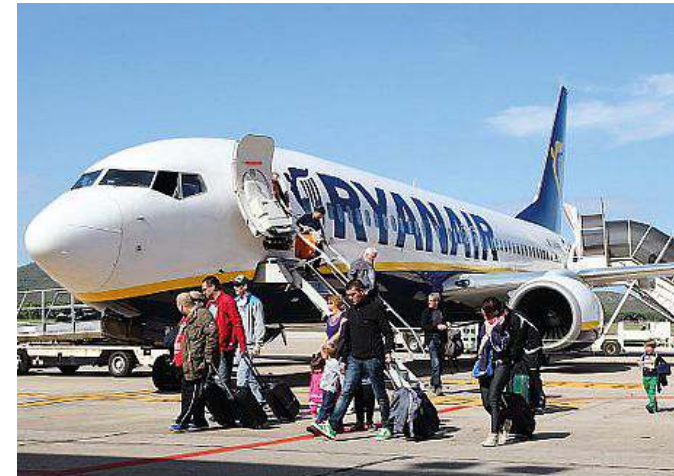
Ryanair ha annunciato che chiuderà a novembre la base di Alghero

«Già parlare di istruttoria a due anni dall'approvazione della legge, votata da tutto il Partito democratico sardo, e a quasi cinque mesi dal decreto del ministero dei Trasporti che attiva il balzello dimostra la prontezza di riflessi dei baroni della giunta regionale. Se poi l'esito corrispondesse all'orientamento espresso dal ministro, sarebbe un vero disastro». (s.s.)