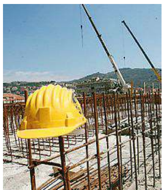
Un cantiere edile

Gli imprenditori: bene il piano di incentivi ma servono sgravi fiscali