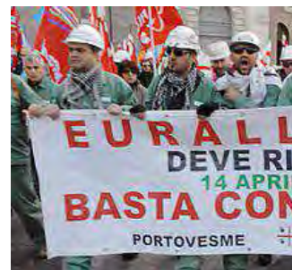
La protesta degli operai Eurallumina

Nell'ultima fase istruttoria che precede la conferenza decisiva per la possibile ripresa produttiva dello stabilimento, gli operai Eurallumina di Portovesme hanno organizzato un presidio a Cagliari davanti all'assessorato regionale dell'ambiente. Un sit-in silenzioso che si è svolto davanti agli uffici regionali, senza megafoni e trombette con l'obiettivo di lanciare ai soggetti che dovranno valutare il progetto, un messaggio chiaro: il "buon senso". Due parole scritte