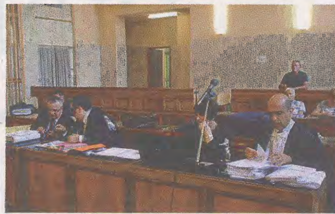
Gli avvocati difensori, le parti civili e il pg durante l'udienza

rese -. Non certo un teste disinteressato, ha inventato così tante cose che a un certo punto non le ricorda più e lo scopriamo in un'intercettazione quando dice "devo ricordare tutte le cazzate che ho detto". E anche le minacce ricevute le colloca temporalmente in maniera tale da tirarsi fuori da tutto».