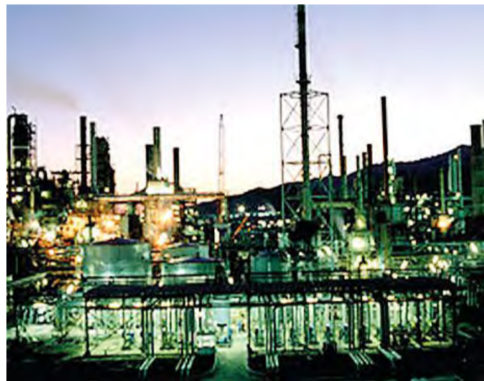
Difficoltà in Sardegna per la trasformazione dei prodotti

Scanu invita quindi le forze politiche e gli altri interlocutori, compresi sindacalisti e dirigenti delle associazioni ambientaliste, a non fare di tutta l'erba un fascio. «Ci sono stati titolari di aziende e società che hanno lasciato solo macerie, inquinamento e disoccupazione - rimanca in proposito - Però ci sono parecchi altri imprenditori one-