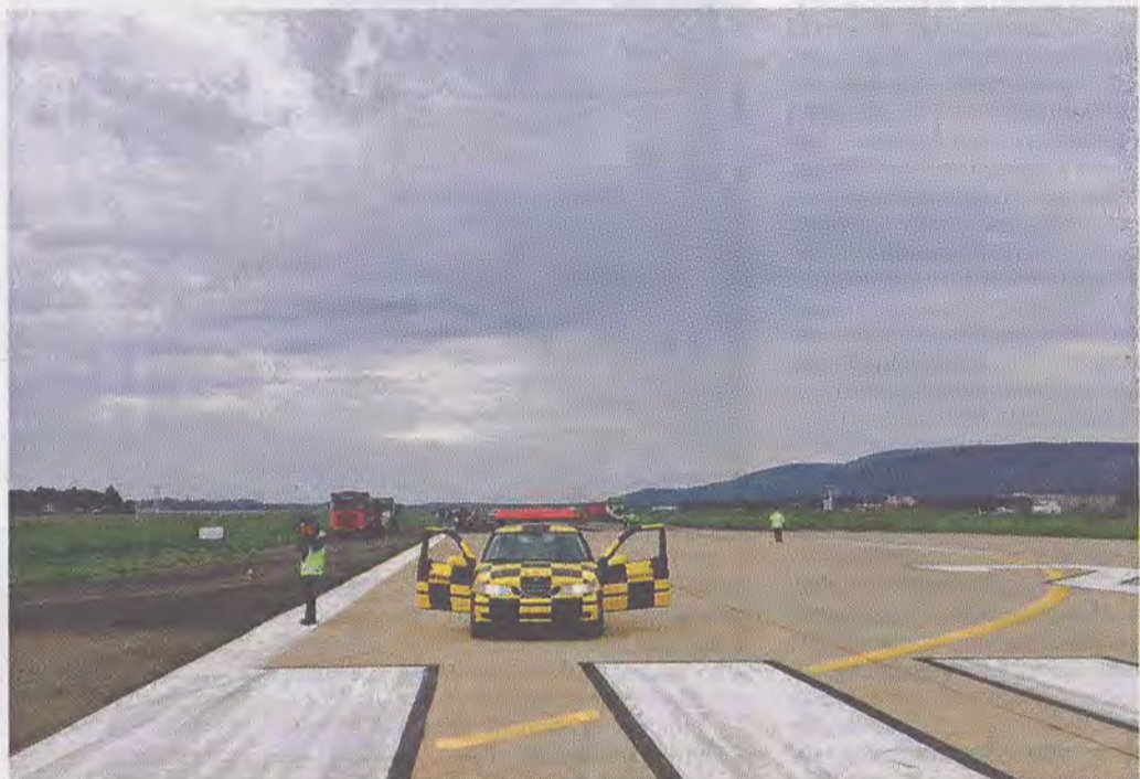
Primi interventi sulla pista dell'aeroporto di Alghero: lo scalo sarà chiuso sino al 6 novembre

Non resta quindi che pazientare una decina di giorni, con la speranza che pioggia e maltempo, non rallentino i lavori. L'intervento non poteva essere evitato anche se, come avevano sollecitato gli operatori economici del territorio, era stato chiesto di salvare il ponte di Ognissanti. Una richiesta rimasta inascoltata, con buona pace di viaggiatori e turisti della bassa stagione. (p.s.)