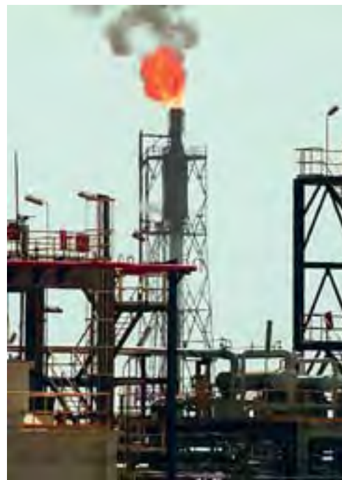
Una torre della raffineria di petrolio della Saras