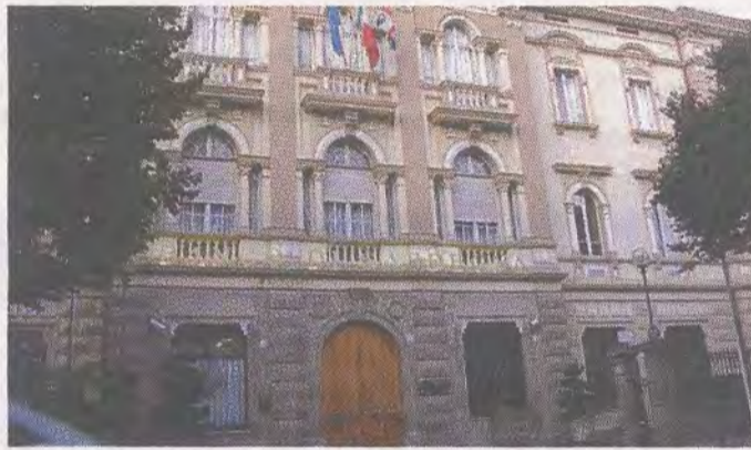
La sede del Banco di Sardegna a Sassari

Numeri significativi per il gruppo a cui fa capo il Banco di Sardegna, anche se si devono ovviamente considerare i voti espressi per delega: i soci effettivamente presenti erano quindi meno ma un colpo d'occhio comunque notevole se si pensa che l'esito era scontatissimo e soprattutto valutando la data più da week end balneare. Migliaia di soci non hanno voluto disertare l'appuntamento con la banca cittadina e con un'assemblea che ha bruciato i tempi: verso le 10,30 gli interventi sul palco e le operazioni di voto per alzata di mano erano esaurite e un'ora dopo l'ammini-