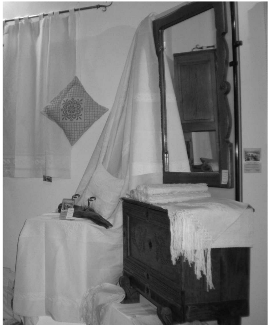
Manufatti in esposizione

Per la Cna si è trattato di una conferma della propria azione positiva che si ripete negli anni a favore