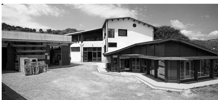
Stabilimenti e macchinari