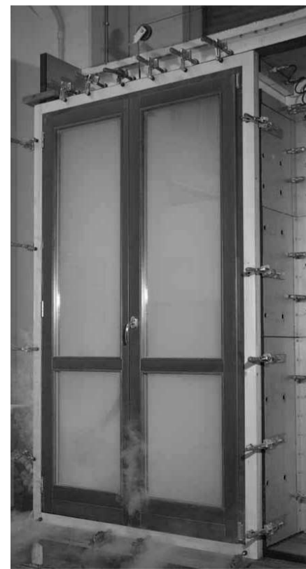
Prova permeabilità all'aria