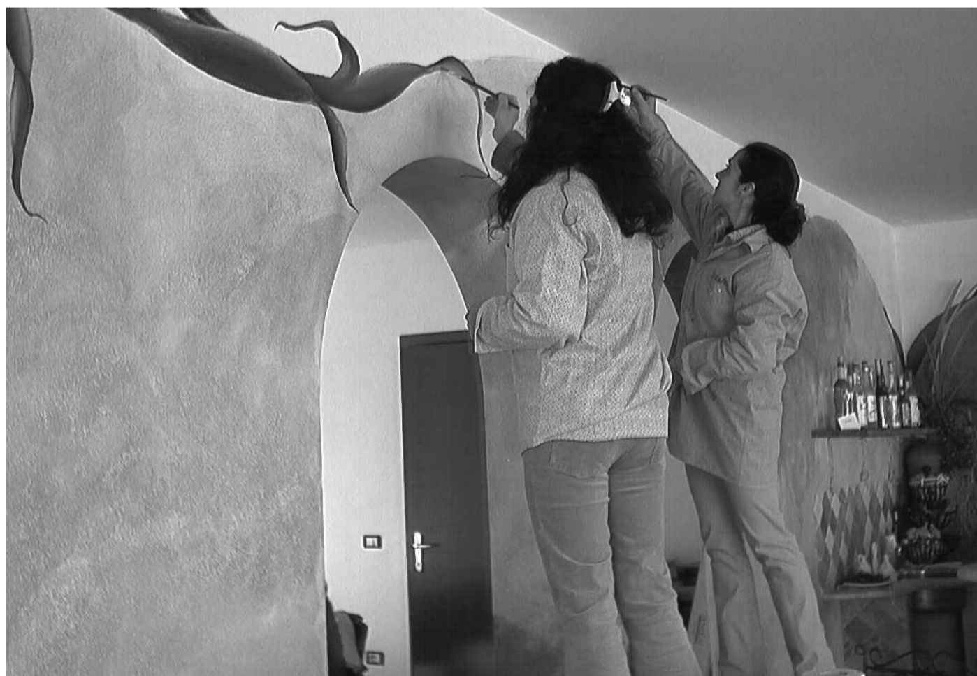
Artigiani al lavoro

"In questi quattro anni la Regione ha cercato di stimolare il sistema delle imprese e l'aggregazione. E in un sistema che si muove in questo senso, la Regione si è presa e si prenderà le proprie responsabilità. Oggi bisogna lavorare per costruire il sistema delle imprese sarde. Utilizziamo i prossimi mesi per completare il lavoro iniziato con il mondo delle imprese, della Cna, dell'Api Sarda, della Confindustria, della Cooperazione. Io sono a disposizione".