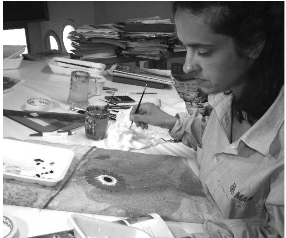
Artigiani al lavoro

"Il Ministro Matteoli mi ha confermato che non è stata rinnovata la concessione alla Tirrenia, per cui il 31 dicembre 2008 cadrà la convenzione in essere. La Regione investirà una parte delle enormi risorse che lo Stato spende oggi con la Tirrenia per facilitare l'accettazione degli oneri di servizio pubblico da parte dei privati: è il modo per rendere il trasporto navale rispettoso delle regole europee, come avviene per quello aereo.