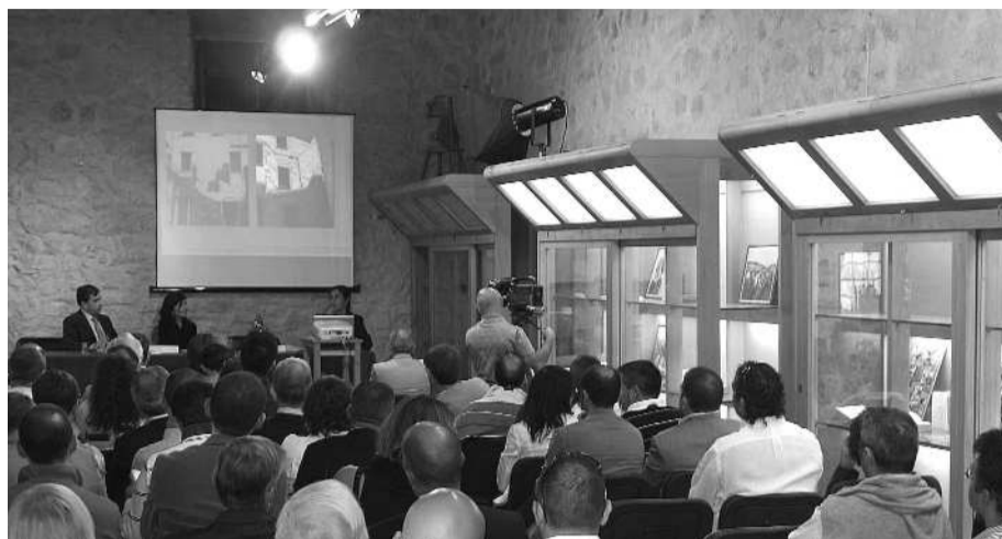
Convegno del 27 settembre 2008

Negli anni certo l'azienda si è evoluta e rispetto al passato oggi viene data anche molta attenzione all'ambiente e al risparmio energetico. "Prima l'interesse veniva concentrato