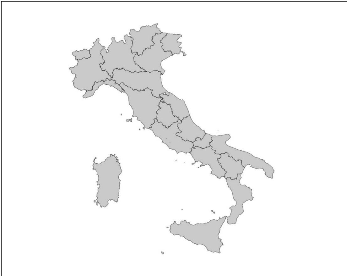
Tavola 45 - Settore mobili (Campioni 7 e 8)