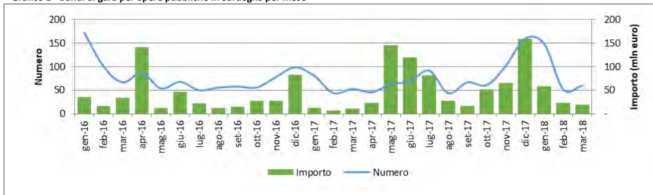
Grafico 1 - Bandi di gara per opere pubbliche in Sardegna per mese

www.cnasardegna.it - regionale@cnasardegna.it